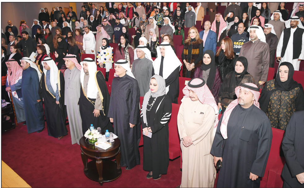
عزف السلام الوطني

وأضاف الجبري: كما يسعدني أن أنقل لكم جميعا تهاني وتحيات سموه حفظه الله بافتتاح